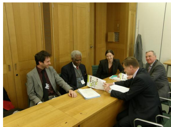
Beyond 2015 avec le Comité de Développement International du Parlement britannique (Mars 2011)

Beyond 2015 a sélectionné un certain nombre de pays clés susceptibles d'exercer leur influence sur le Sommet sur les OMD de 2013 (une étape clé pour les discussions intergouvernementales sur le post-2015). Bien qu'il soit trop tôt pour connaître les positions de tous les gouvernements clés en relation avec le cadre post-2015, Beyond 2015 a développé des relations avec la société civile dans chacun de ces pays prioritaires, et se trouve bien placé pour avoir une vision privilégiée des processus de réflexion de ces pays, lorsque leurs positions commencent à prendre forme en 2012 et 2013.