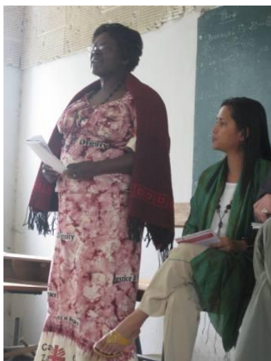
Taller de Beyond 2015 en el Foro Social Mundial en Dakar, Senegal (Marzo 2011)

Objectif stratégique 2011: le scénario post-2015 fait l'objet d'un débat officiel aux Nations Unies (attention particulière au Rapport annuel du Secrétaire général sur les OMD, la Conférence Rio+20 et tout groupe de travail créé par les Nations Unies).